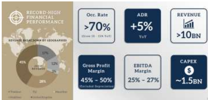
Fig 2: 2023E target