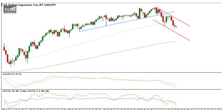
กลยุทธ์ Hold Short 151.0 Let's Profit Run Stop >149.8

EURUSD : ภาพรายวัน ราคาเริ่มชะลอกำลังลงบ้างหลังขึ้นทำจุดสูงสุดใหม่ในภาพระยะสั้นก่อนหน้า ขณะที่เครื่องมือทางเทคนิค MACD, RSI และ SSto เริ่มชะลอกำลังลงเช่นกัน ทำให้คาดว่าราคามีโอกาสแกว่งตัวออกด้านข้างได้ แนวรับ 1.0910 / 1.0855 แนวต้าน 1.1060 / 1.1120