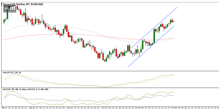
กลยุทธ์ Trading ในรอบ 1.0910 – 1.1120

USDTHB : ภาพรายวัน ราคาอ่อนตัวลงทดสอบแนวรับที่กรอบทิศทางแนวโน้มขาลงแล้วพยายามรีบาวด์กลับขึ้นบ้าง ขณะที่เครื่องมือทางเทคนิค MACD ให้สัญญาณขาย แต่ RSI และ SSto อยู่ในภาวะ Oversold แล้ว ทำให้คาดว่าราคามีโอกาสรีบาวด์ได้บ้างในระยะสั้น แนวรับ 34.50 / 34.00 แนวต้าน 35.00 / 35.20