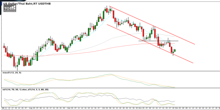
กลยุทธ์ Trading Short ในรอบ 35.20 – 34.00

USDTHB : ภาพรายวัน ราคาอ่อนตัวลงทดสอบแนวรับที่กรอบทิศทางแนวโน้มขาลงแล้วพยายามรีบาวด์กลับขึ้นบ้าง ขณะที่เครื่องมือทางเทคนิค MACD ให้สัญญาณขาย แต่ RSI และ SSto อยู่ในภาวะ Oversold แล้ว ทำให้คาดว่าราคามีโอกาสรีบาวด์ได้บ้างในระยะสั้น แนวรับ 34.50 / 34.00 แนวต้าน 35.00 / 35.20