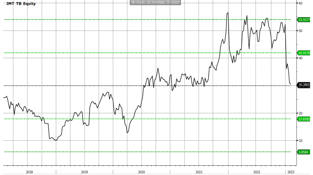
รูปที่ 3: PE ของ JMT กลับลงมาสู่ระดับค่าเฉลี่ยแล้ว