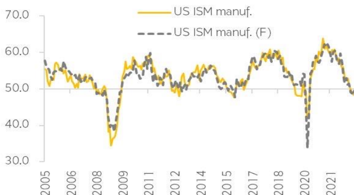
Figure 1: ISM Index could improve slightly in January but remain depressed

Fundamental investment analyst on securities +662 659 7000 ext. 5001 isara.ordeedolchest@krungsrisecurities.com