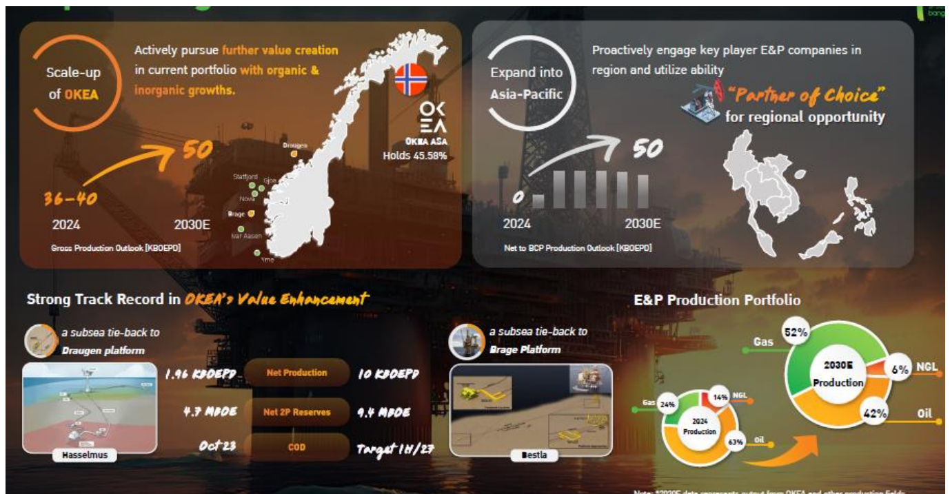
Fig 4. E&P business plan