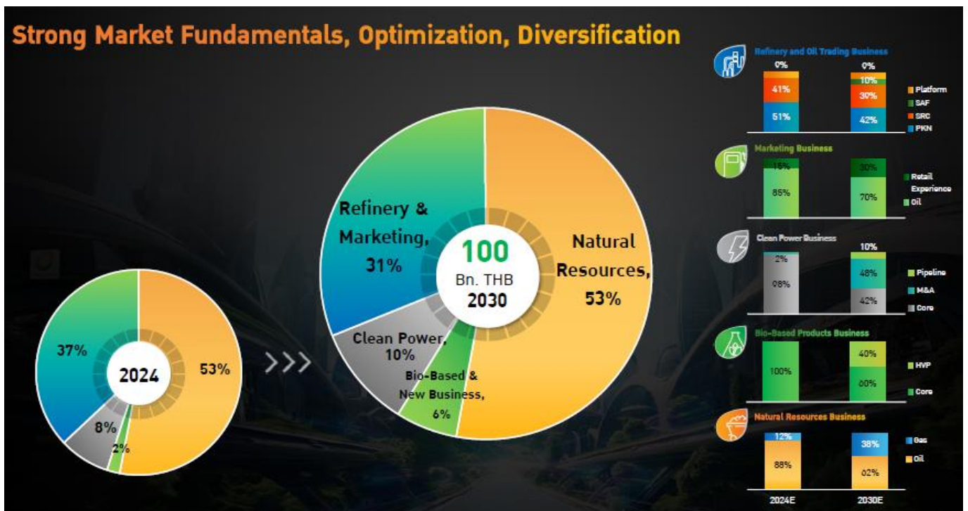
Fig 6. EBITDA target