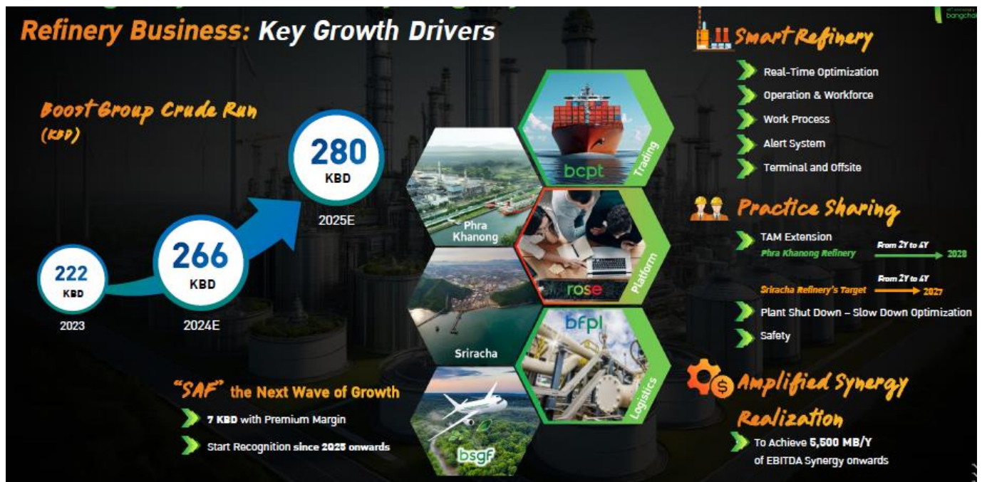
Fig 1. Refinery business target