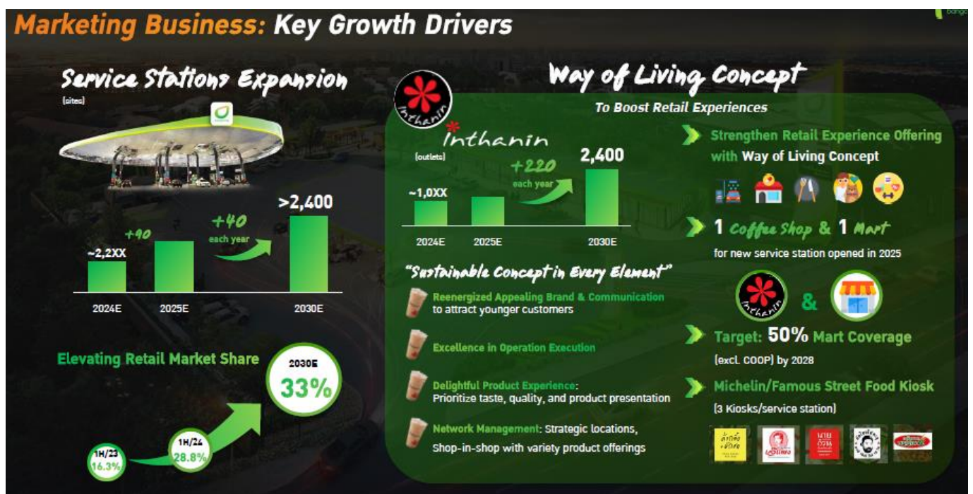
Fig 2. Marketing Business: Non-oil is key growth