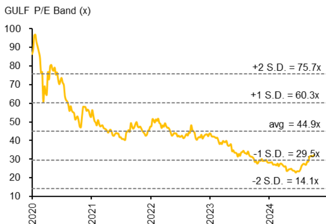
Fig 1.: Prospective P/E band