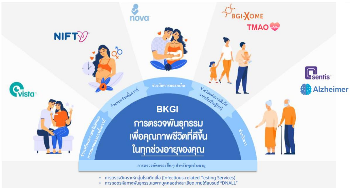
Fig. 1 Scope of service