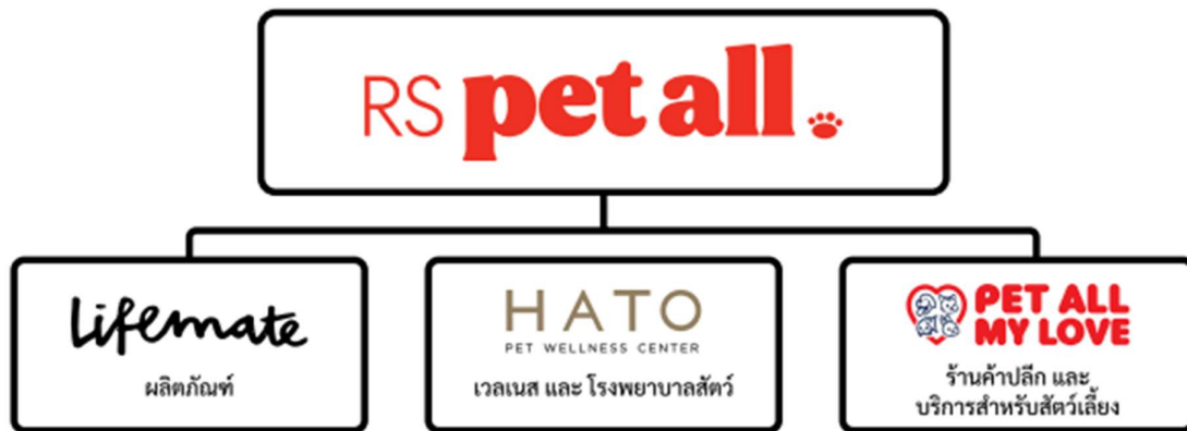
Fig 5. สินค้าและบริการสำหรับสัตว์เลี้ยง