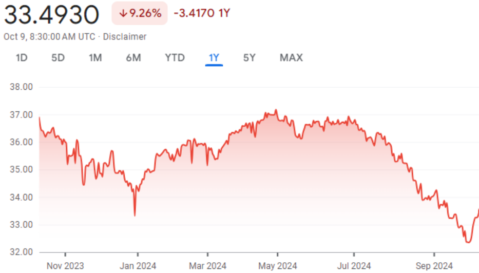
Fig 4: Stronger THB has affected 3Q24 profit