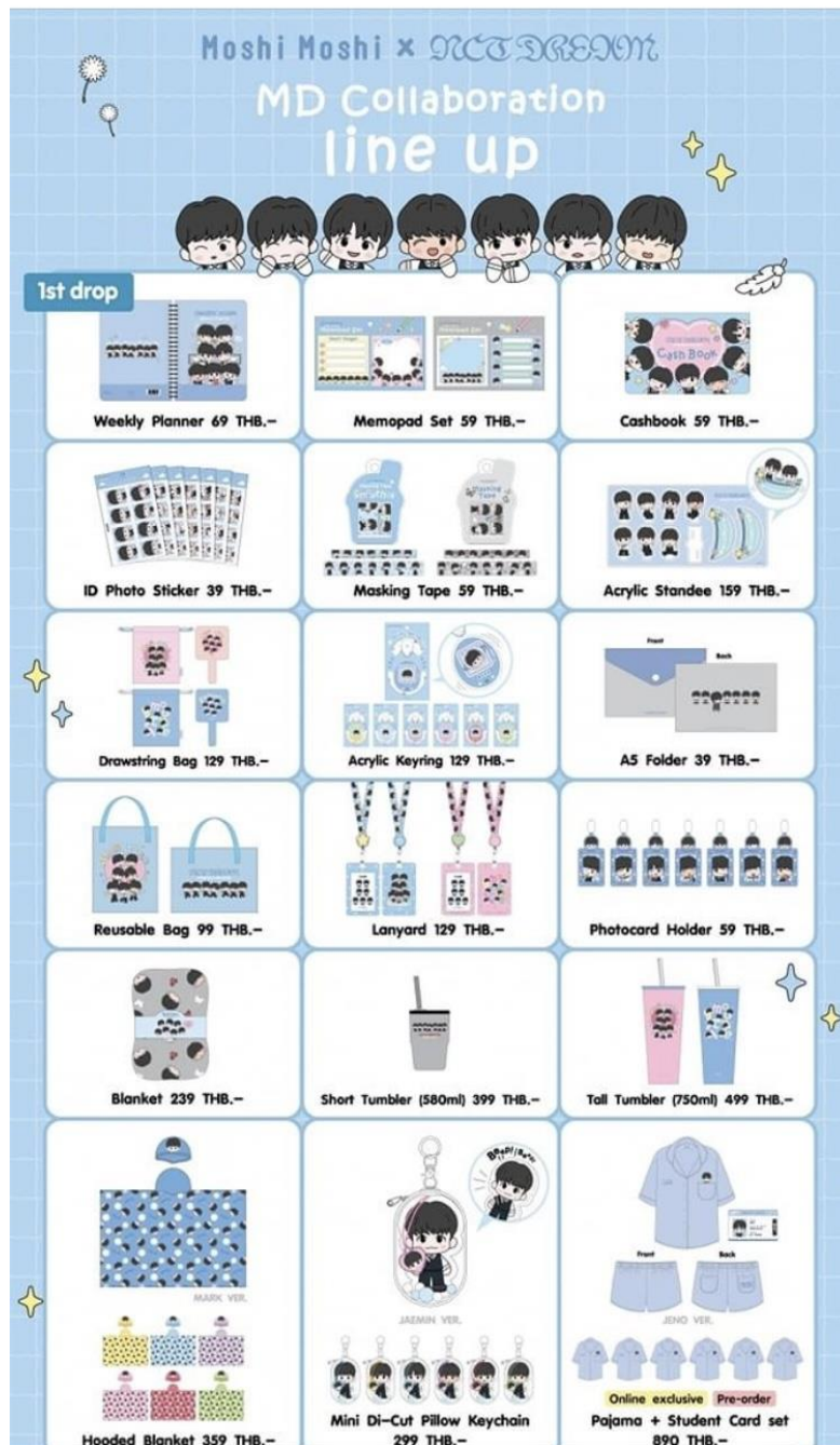
Fig. 1: Moshi Moshi* NCT DREAM products