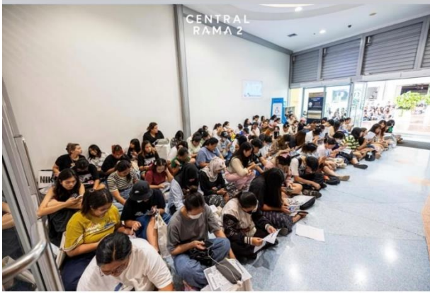
Fig. 2: Central Rama 2