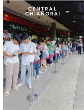
Fig. 3: Central ChiangRai