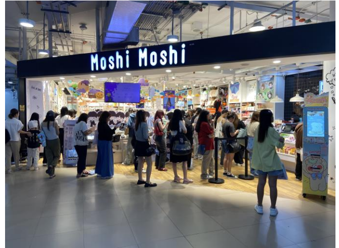
Fig. 7: Siam Square one at 17.00