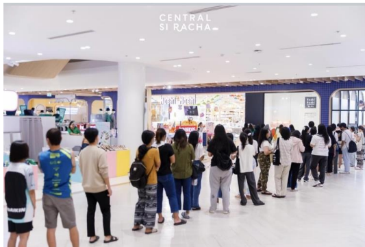
Fig. 4: Central Sriracha