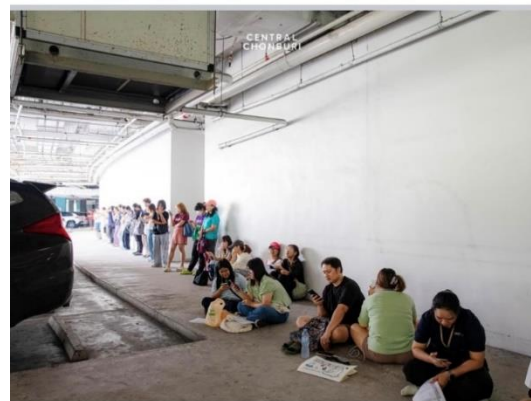
Fig. 5: Central Chonburi