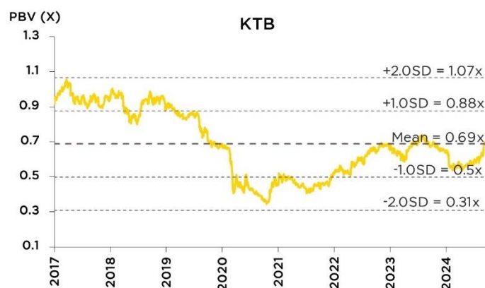
Fig. 2: Historical PBV band – KTB