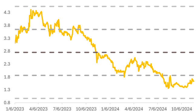
Fig. 2: 5-Year Forward PBV band