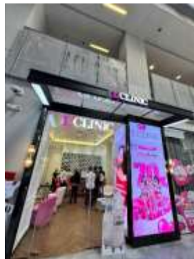
Fig 2: L'Clinic สาขาสยามสแควร์วัน