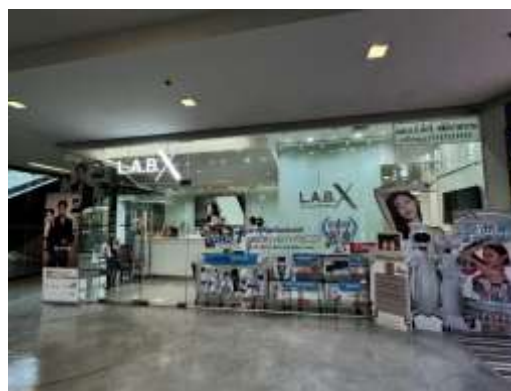
Fig 4: L.A.B. X สาขาสยามสแควร์วัน