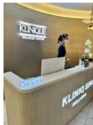
Fig 7: KLINIQ SPA