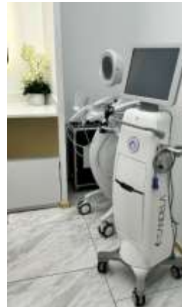
Fig 5: เครื่อง Candela Matrix Pro ที่มีที่ The Klinique ที่แรกในไทย