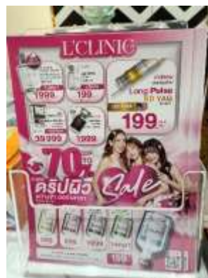
Fig 3: ตัวอย่างหัตถการที่ให้บริการที่ L'Clinic สาขาสยามสแควร์วัน