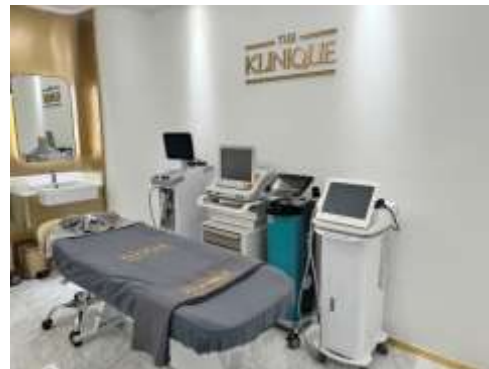
Fig 6: The Klinique มีเครื่องต่างๆที่ให้บริการที่ครบครัน ทันสมัย