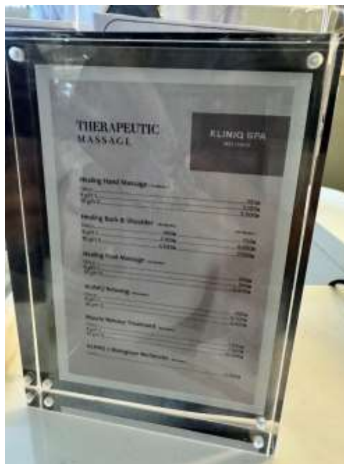
Fig 8: ราคาบริการต่างๆที่ KLINIQ SPA ราคา competitive