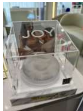
Fig 1: บริการเสริมหน้าอก Motiva – Joy ที่ The Klinique Surgery Center

คงราคาเป้าหมายที่ 50.00 บาท ถึง 2024E PER 30.0x เราชอบ KLINIQ จาก 1) จำนวนสาขาที่ครอบคลุมทั่วประเทศ อีกทั้งยังมีสาขาที่ขยายต่อเนื่อง และ 2) valuation ไม่แพงโดยเทรดอยู่ที่ PER 26.1x ยังไม่สะท้อนกำไรปี 2024E-25E ที่เติบโตทำสถิติสูงสุดใหม่ต่อเนื่อง