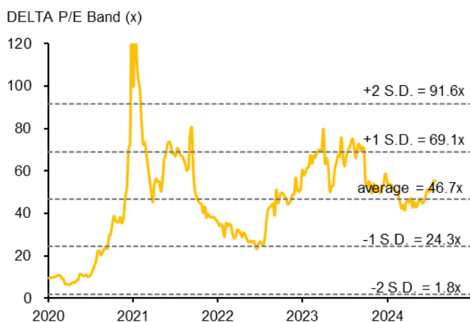
Fig 2. Prospective P/E band