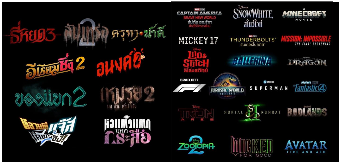
Fig. 3: Big movies of 2025

Important note: Box Office = Revenue from movies theaters only in Bangkok, surrounding areas and Chiang Mai Note: *Based on box office income from previous seasons