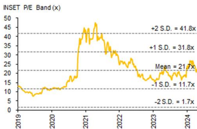
Fig. 2: INSET's Forward PER Band

ค่าใช้จ่าย SG&A /Sales งวด 4Q25 อยู่ที่ 2.4% (vs 2.3% ใน 4Q23 และ 9.5% ใน 3Q24) แปรผันไปตามฐานรายได้ตามช่วงเวลาการส่งมอบงาน ซึ่งงวด 4Q23 ขาดงาน ส่วน 3Q24 เป็นช่วงส่งมอบงานมาก