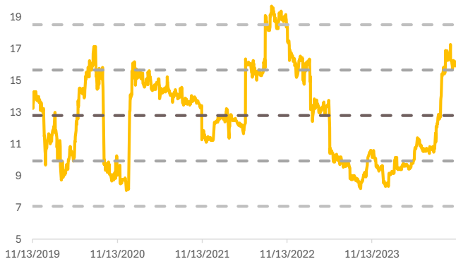
Fig. 1: Forward P/E band

คาดการณ์ได้ 8.0 พันลบ. (+33%y-y, -4% q-q) จากปริมาณขายยางมะตอยคาด 3.2 แสนตัน vs 4Q23/3Q24 2.5/3.3 แสนตัน แบ่งเป็น i) ไทย คาด 1.3 แสนตัน vs 3Q23/4Q24 0.7/1.8 แสนตัน อิงตามการเบิกจ่ายงบรัฐ ที่ฐานปีก่อนต่ำมากจากงบเบิกจ่ายล่าช้า แต่ยังคงลด q-q จากเป็นช่วงเริ่มปีงบประมาณ โดยอิงการเบิกจ่ายงบลงทุนรัฐ 4Q24 เหลือ 1.0 หมื่นลบ. -15% y-y, -84% q-q ii) ต่างประเทศคาดปริมาณขาย 1.9 แสนตัน vs 4Q23/3Q24 1.8/1.5 แสนตัน ยังเพิ่มขึ้นเป็นจุดสูงสุดของปี จากเป็นช่วง High season ของอินโดนีเซีย และเวียดนาม ด้าน ราคายางมะตอยไทย คาด 2.7 หมื่นบาท/ตัน ใกล้เคียง q-q และสอดคล้องกับราคากลางยางมะตอย ส่วนราคาต่างประเทศที่ 445 เหรียญ/ตัน -4% y-y, +2% q-q คาด Gross margin 13.8% vs 4Q23/3Q24 9.6/16.4% จาก i) สัดส่วนการขายจากไทย (High margin) 43% vs 4Q23/3Q24 26%/60% ii) รูปแบบราคายางมะตอยในต่างประเทศ งวดนี้เป็นลักษณะ Downward ทำให้มีผลต่อการบริหารจัดการ stock