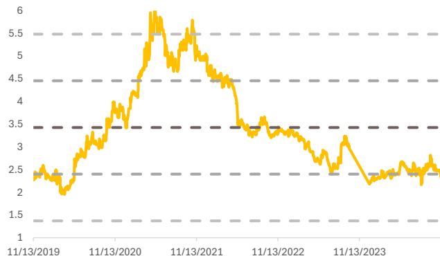
Fig. 2: Forward P/BV band