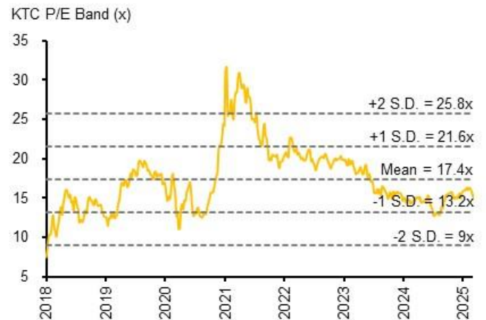
Fig. 3: Forward PER band – KTC