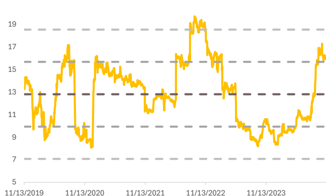
Fig. 2: Forward P/E band

Gross margin 12.4% vs 4Q23/3Q24 9.6/16.4% จาก i) สัดส่วนการขายจากไทย (High margin) 54% vs 4Q23/3Q24 26%/60% ii) รูปแบบราคาขายยางมะตอยในต่างประเทศ งวดนี้เป็นลักษณะ Downward ซึ่งมีผลต่อการบริหาร Stock (ขาดทุน Stock) เนื่องจากเป็นการขายแบบซื้อมาขายไป (Trading) สัดส่วนกว่า 80%